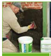
KÖSTER KD 3 Sealer