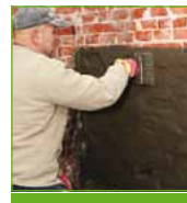
KÖSTER KD 1 Base

Hay que preparar tanto KÖSTER KD 1 Base con agua como se puede aplicar en 10 minutos. Mezclar el material hasta que se forme una masa viscosa y pintable (como una lechada mineral de impermeabilización). Se aplica con un cepillo. Inmediatamente después restregar el polvo KÖSTER KD 2 Blitz powder en la capa fresca y mojada hasta que la superficie