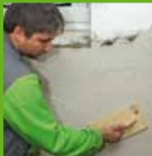
Alisar la superficie

Aplicar KÖSTER Polysil® TG 500 como imprimación para fortalecer el sustrato y reducir la movilidad de los sales. KÖSTER revoques de restauración están disponibles en gris o blanco. En edificios históricos pueden ser utilizados como revoco decorativo aun sin pintura. Son aparejados para la utilización interior y exterior.