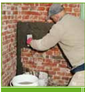
KÖSTER KD 1 Base