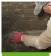
KÖSTER KD 2 Blitz