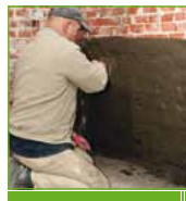
KÖSTER KD 1 Base