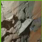
Aplicación del KÖSTER revoque de restauración