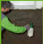
Imprimación con KÖSTER Polysil® TG 500

KÖSTER revoques de restauración están especialmente diseñados para la restauración de mampostería. No están afectados por contenidos altos de sal y humedad y impiden a los sales de difundir hasta la superficie. Cuando humedad ascendente está parado con KÖSTER Crisin® 76, KÖSTER revoques de restauración ayudan a secar los muros y absorben los sales restantes. KÖSTER revoques de restauración resisten a condiciones húmedas porque no contienen cal ni yeso. Están abiertos a difusión de vapor de agua y ayudan a crear un ambiente sano y confortable.