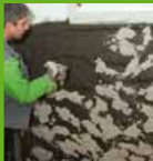
Aplicación del revoque